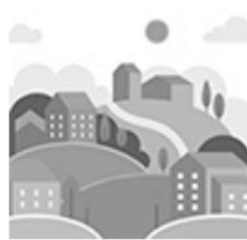
enti di decentramento regionale