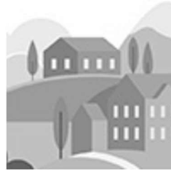
comunità obbligatorie e volontarie